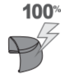
100% IMPACT ABSORBER